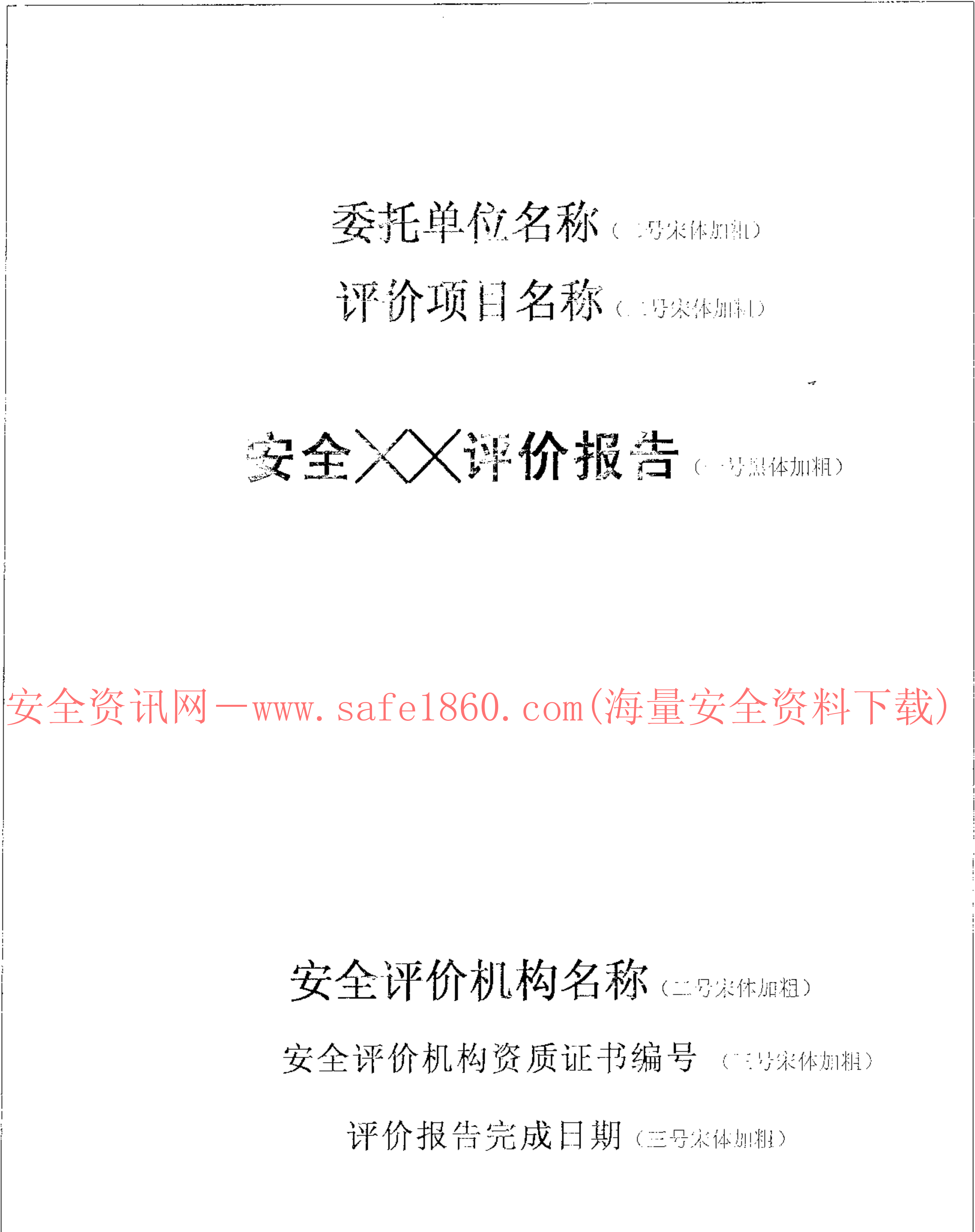
图 D.1 封面式样